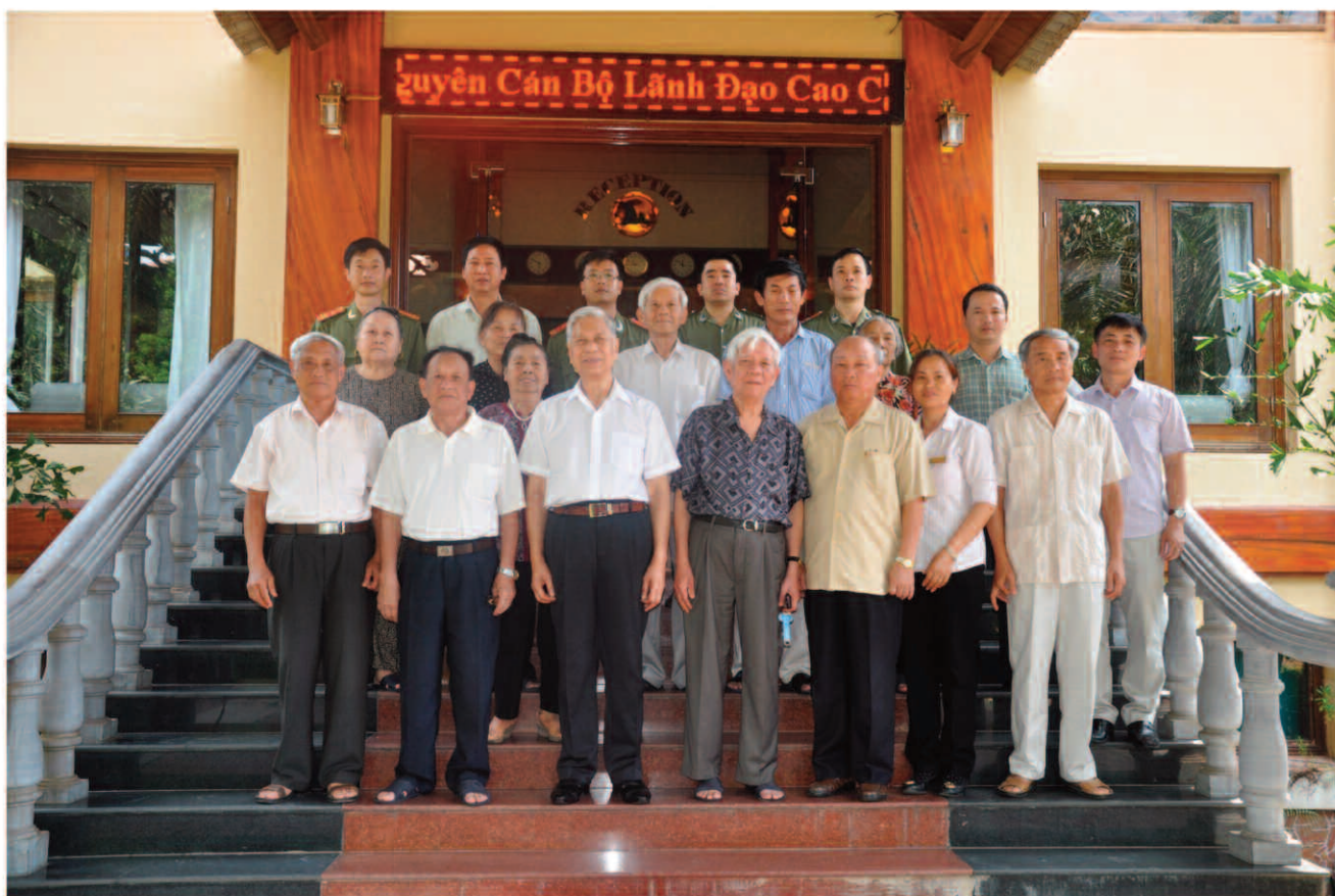
Đoàn cán bộ cao cấp của Đảng, Nhà nước tham gia kỳ nghỉ điều dưỡng và kết hợp điều trị bệnh lý đợt II, năm 2015 tại Bãi Lữ Resort, Nghệ An.